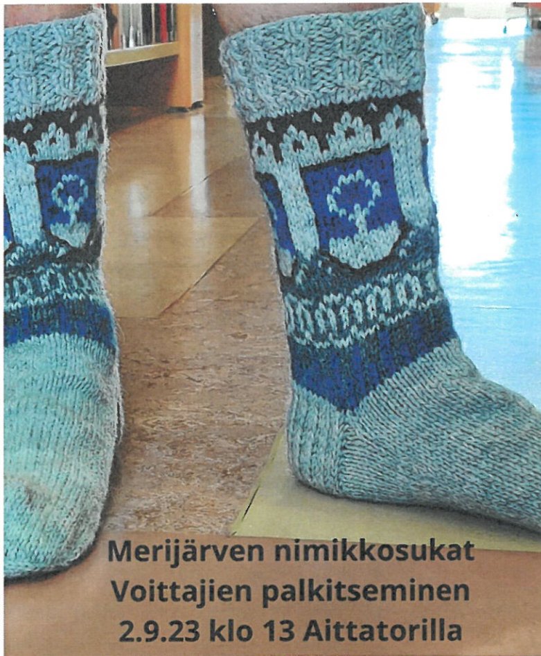
Merijärven nimikkosukat Voittajien palkitseminen 2.9.23 klo 13 Aittatorilla